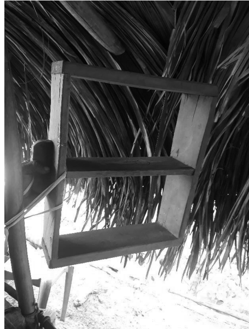
Fig. 03: Forma para produção do adobe.

A produção é simples, há apenas a mistura do barro com a água, coloca a massa na forma e imediatamente remove a forma, deixando a massa no formato retangular (Fig. 03).