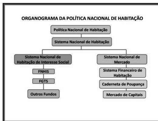
Fig. 01: Organograma da Política Nacional.

Governo Federal para com as habitações de interesse social através de dois sistemas como demonstra a Figura 01.