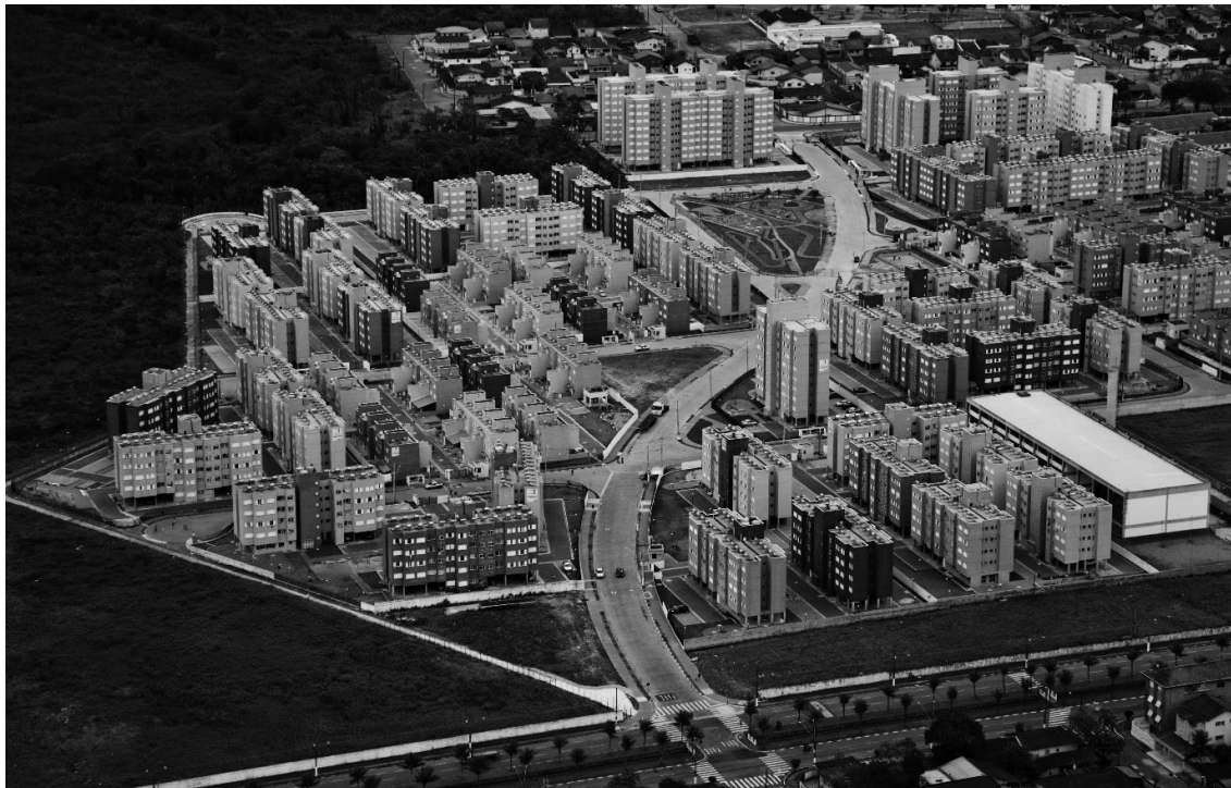
Figura 1. Projeto Urbano e Arquitetônico para Habitação de Interesse Social, o Loteamento Rubens Lara viabilizou a realocação de famílias que moravam em áreas de risco da região do litoral do Estado de São Paulo.

O projeto desperta senso de cidadania e gera oportunidades de desenvolvimento pessoal aos moradores. Com critérios de desenho universal e adoção de soluções construtivas sustentáveis, as edificações e o espaço público estão integrados promovendo qualidade de vida, lazer e convivência social.