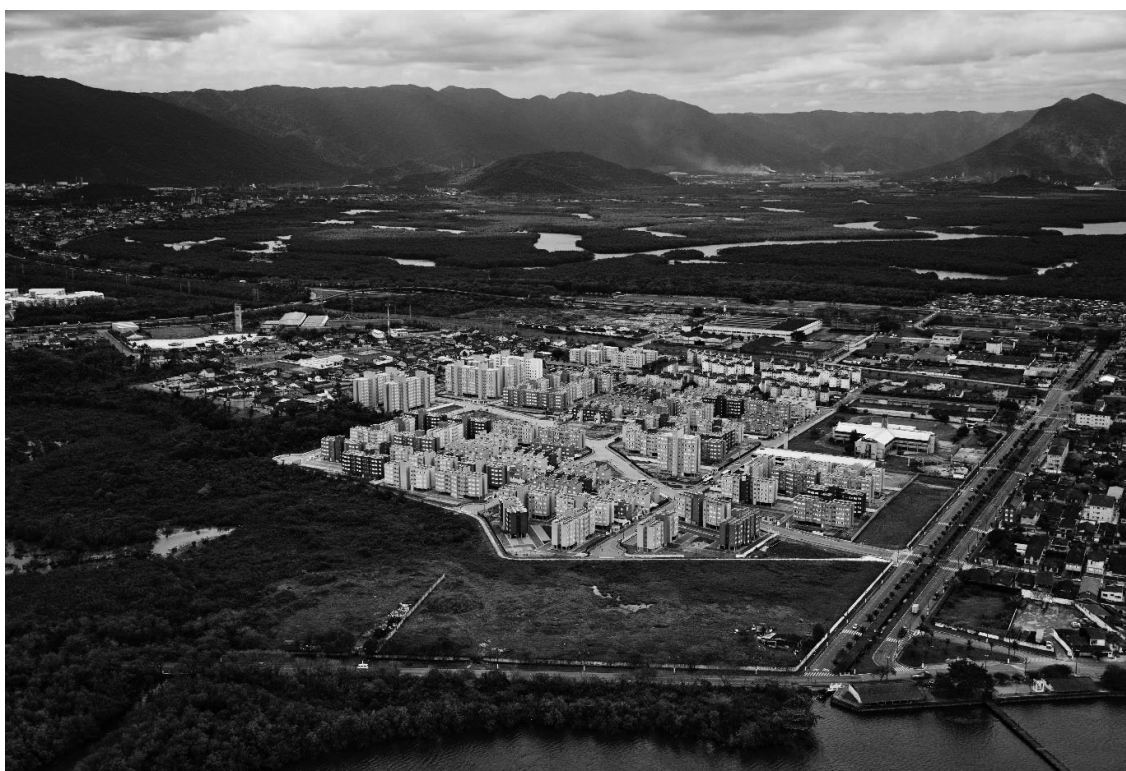
Figura 3. O trabalho atendeu à demanda por 1.840 moradias e garantiu a regularização fundiária para o direito à casa própria.